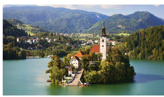
L'isola del lago di Bled