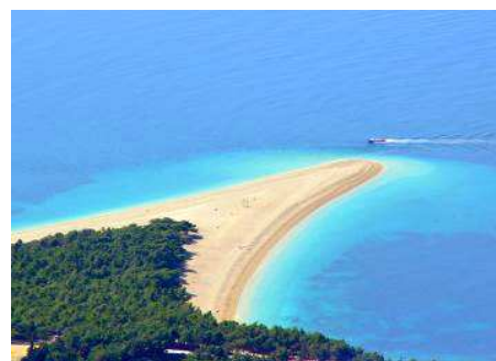
Isola di Brač: spiaggia di Bol