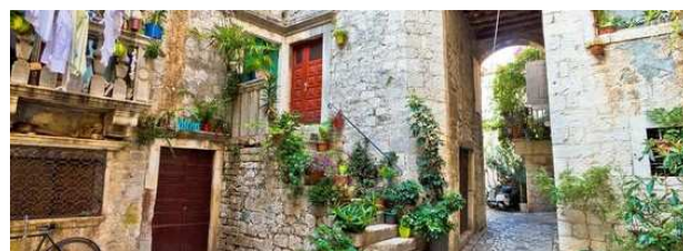
Trogir: il centro storico