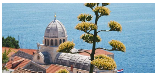
Sebenico: La Cattedrale

Ritrovo dei Signori partecipanti nei luoghi ed agli orari prestabiliti. Sistemazione in pullman Gran Turismo e partenza per il confine sloveno e poi croato. Pranzo libero in corso di viaggio. Arrivo a SEBENICO , incontro con la guida e inizio delle visite. Fondata oltre mille anni fa dai Croati, la città possiede alcune delle più preziose opere d'arte dell'intera Dalmazia come la cattedrale gotico-rinascimentale di San Giacomo (Patrimonio Unesco), il maggior monumento d'arte sacra della città, la cui cupola di pietra bianca domina, come una corona, l'intera città. Al termine della visita, sistemazione in hotel sulla riviera di Sebenico, cena e pernottamento.