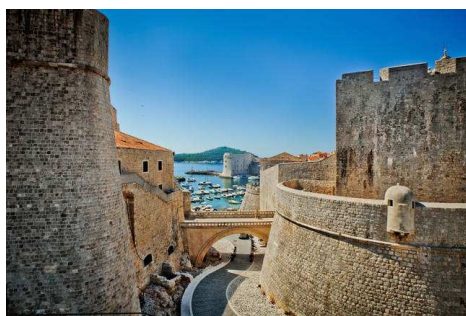
Dubrovnik: le mura

Ubicata nell'estremità meridionale della Croazia, arricchita per secoli dalle migliori opere di architetti e artisti, Dubrovnik vanta un caldo clima mediterraneo grazie al quale, oltre alla vegetazione tipicamente mediterranea, vi cresce anche quella subtropicale, con piantagioni di limoni, aranci e mandarini profumati, mentre le palme e le agavi lussureggianti abbelliscono i parchi rinascimentali ed i giardini fioriti dei palazzi medioevali in pietra e degli umili conventi. Visita del convento francescano con una tra le più antiche farmacie d' Europa, la chiesa di S. Biagio, il Palazzo dei Rettori, la piazza della Loggia con la statua del paladino Orlando (leggendaro simbolo della libertà della città), il Palazzo Sponza, il Palazzo della Gran Guardia, la Torre dell' Orologio, fontana di Onofrio, la Cattedrale, ecc. Al termine della visita pranzo in ristorante. Dopo il pranzo proseguimento per Makarska, sistemazione in hotel sulla riviera di Makarska. Cena e pernottamento.