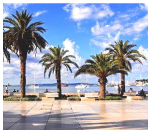
Spalato: il lungomare