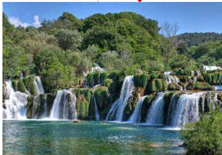
Parco Nazionale Fiume Krka