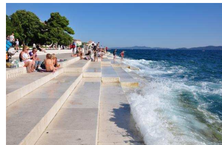
Zara: l'organo marino