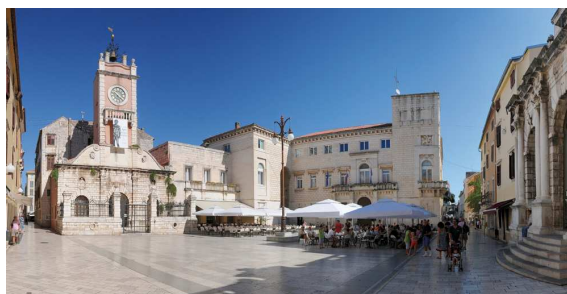
Zara: la piazza centrale