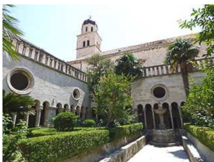
Dubrovnik: Chiostro dei Francescani