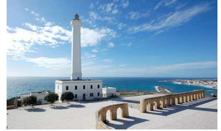
Santa Maria di Leuca