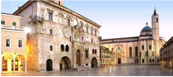
Lecce: Piazza del Duomo

isolotto completamente circondato dal mare limpido e cristallino del Salento e collegato alla parte nuova della città da un ponte pullulante di vita. Al termine delle visite rientro in hotel a Lecce. Cena e pernottamento.