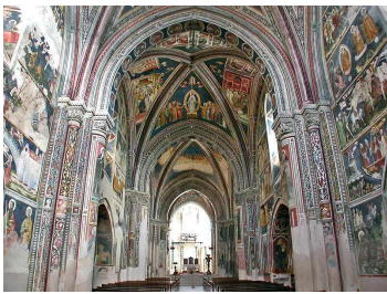
Galatina: gli affreschi della Basilica di S.Caterina

Prima colazione in hotel. In mattinata partenza con guida per l'escursione lungo la costa salentina. Arrivo ad OTRANTO , situato sulla costa adriatica della penisola salentina, è il comune più orientale d'Italia: il capo omonimo, chiamato anche Punta Palascia, a sud del centro abitato, è il punto geografico più a est della penisola italiana. Salta subito all'occhio come Otranto sia una città fortificata, il cui borgo antico sia racchiuso da mura difensive al cui intero si trovano i monumenti come il Castello Aragonese e la cattedrale con un pavimento a mosaico del 1163. Pranzo in ristorante. Nel pomeriggio sosta a SANTA MARIA DI LEUCA per la visita del Santuario posto proprio nella punta estrema dell'Italia. Proseguimento per GALATINA , cittadina nel cuore del Salento barocco, si visiterà la Basilica di Santa Caterina d'Alessandria il cui interno è ricco di affreschi che costituiscono una specie di museo della pittura del Quattrocento. Al termine delle visite rientro in hotel a Lecce per la cena e il pernottamento.