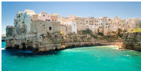
Polignano a Mare

Dopo la prima colazione incontro con la guida e partenza per la visita di POLIGNANO A MARE , uno dei borghi più poetici della regione, vera perla dell'Adriatico. La località arroccata sulla costa alta e frastagliata è un sogno ad occhi aperti, set di diversi film è anche la Città natia del celebre cantante Domenico Modugno interprete della famosa canzone "Nel blu dipinto di blu". Proseguimento con la visita di LOCOROTONDO località tra i "Borghi più belli d'Italia", un vero balcone sulla valle d'Itria; lo stesso nome indica la caratteristica forma circolare del centro antico del paese, sorto attorno all'anno mille, costituito da un insieme di casupole che gli agricoltori edificarono sulla sommità del colle, tra cui le tipiche "cummerse", casette dal tetto spiovente. Pranzo in ristorante . Nel pomeriggio visita di MARTINA FRANCA caratterizzata dalle mura di cinta, le torri, le porte della città che ancora esistono dal 1300 e dal suggestivo centro storico, di singolare bellezza che si presenta agli occhi del visitatore come uno scenografico dedalo di viuzze, bianche casette e incantevoli stradine ove si ergono pregevoli palazzi barocchi con stupende balconate in ferro battuto. A Martina Franca si potranno ammirare la pregiata Basilica di San Martino e il barocco Palazzo Ducale. Al termine delle visite proseguimento per Lecce. Arrivo e sistemazione in hotel nelle camere riservate. Cena e pernottamento.