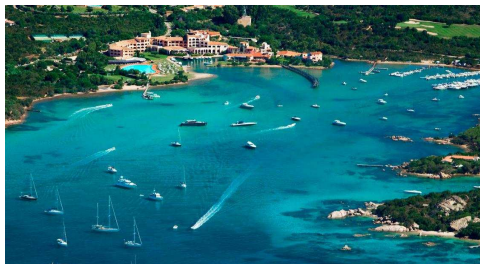
Costa Smeralda: Porto Cervo

Prima colazione in hotel. In mattinata visita guidata della Costa Smeralda , meraviglioso lembo di terra del Mediterraneo bagnato da un mare cristallino di acque limpidissime e turchesi. Visita di Porto Cervo e dei suoi angoli più caratteristici, la Piazzetta, il Porto Vecchio e le sue boutiques di lusso. Rientro in hotel per il pranzo. Nel pomeriggio partenza per la Costa di Stintino . La penisola di Stintino si protende nel mare dell'Isola dell'Asinara, da cui è separata da un braccio di mare poco profondo. A fare di Stintino, piccolo paese di pescatori, una delle mete favorite dal turismo sono state senza dubbio le sue meravigliose spiagge come la Spiaggia della Pelosa dai meravigliosi colori dettati dalle differenze dei fondali. La spiaggia è caratterizzata da sabbia bianchissima e impalpabile come il talco. Al termine delle visite proseguimento per Alghero (o zone limitrofe). Sistemazione in hotel nelle camere riservate. Cena e pernottamento.